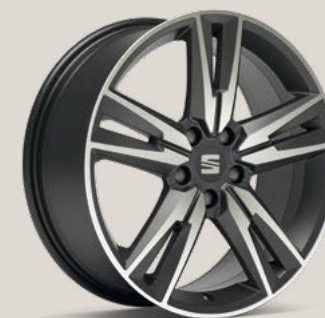
Performance Cosmo Grey