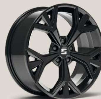
Exclusive Glossy Black FBI PYB