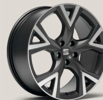
Exclusive Cosmo Grey Type 2 FBI P9A