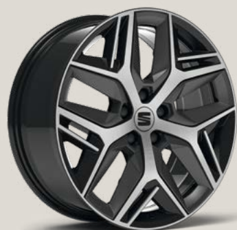
Exclusive Cosmo Grey Type 1 FBI PUV

In de CarConfigurator tref je de bandenlabels aan van jouw configuratie.