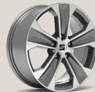
Dynamic Nuclear Grey