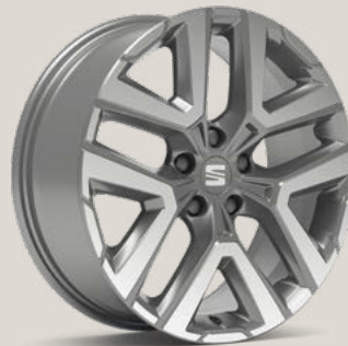
Performance II Nuclear Grey