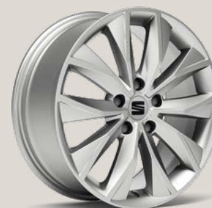
Dynamic Brilliant Silver