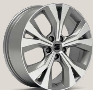
Performance Nuclear Grey