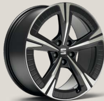
Aerowheels Cosmo Grey FBI P8U