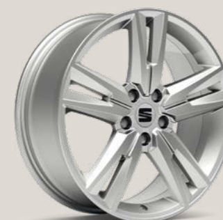
Performance Brilliant Silver type 2