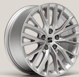
Performance St PUB