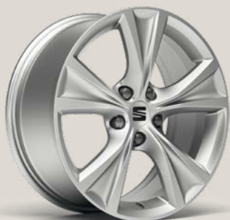
Dynamic FBI FPH