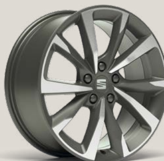
Performance FBI FPH PUK