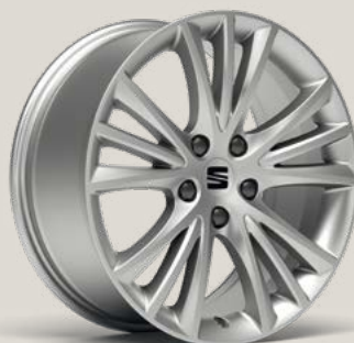
Dynamic St PUA